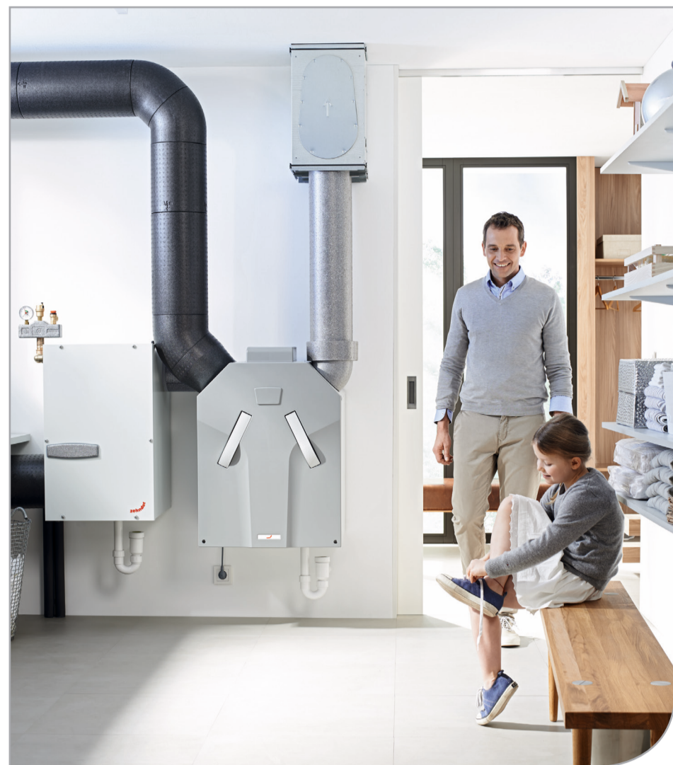
Zehnder ComfoAir 350 + ComfoFond-L 350

Glikolowy, gruntowy wymiennik ciepła jest stosowany jako zabezpieczenie zrównoważonej wentylacji mechanicznej przy niższych temperaturach zewnętrznych. Wstępne podgrzewanie oraz schładzanie czerpanego powietrza, a także w pełni automatyczne sterowanie przez jednostkę Zehnder ComfoAir zapewnia optymalny komfort w wentylowanych pomieszczeniach. Zaletami tego rozwiązania są m.in.: kompaktowa budowa, montaż możliwy na ścianie lub podstawie tuż przy jednostce wentylacyjnej, higiena, zamknięty oraz szczelny układ wymiennika gruntowego.