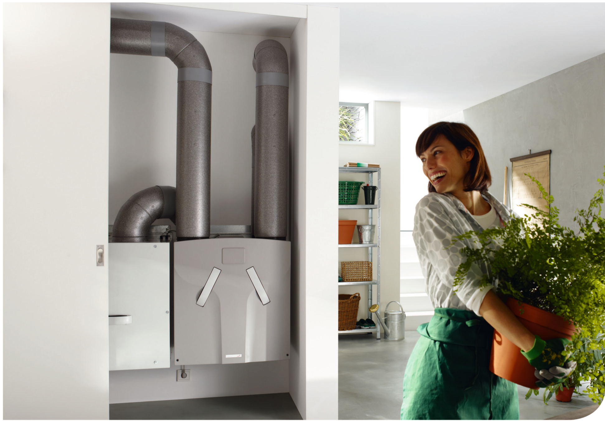
Zehnder ComfoAir 450/550 + ComfoFond-L 550

Zehnder ComfoFond-L wykorzystuje stałą temperaturę gruntu do odzysku ciepła i regulacji temperatury powietrza doprowadzanego. W celu podgrzania lub schłodzenia doprowadzanego powietrza, kolektor poziomy lub sonda magazynują energię geotermalną. Zawarta w nich energia oddawana jest do czerpanego świeżego powietrza doprowadzanego przez wymiennik ciepła ComfoFond-L, który podłączony jest do jednostki wentylacyjnej. Wiosną i jesienią, gdy powietrze na zewnątrz i grunt mają zbliżoną temperaturę, nie ma potrzeby korzystania z gruntowego wymiennika ciepła. Z tego powodu pompa obiegowa Zehnder ComfoFond-L aktywowana jest automatycznie wyłącznie w razie potrzeby. Dzięki prostej instalacji kolektora gruntowego Zehnder ComfoFond-L sprawdza się przede wszystkim w domach jedno- i dwurodzinnych jako rozsądne i korzystne uzupełnienie systemu wentylacyjnego.