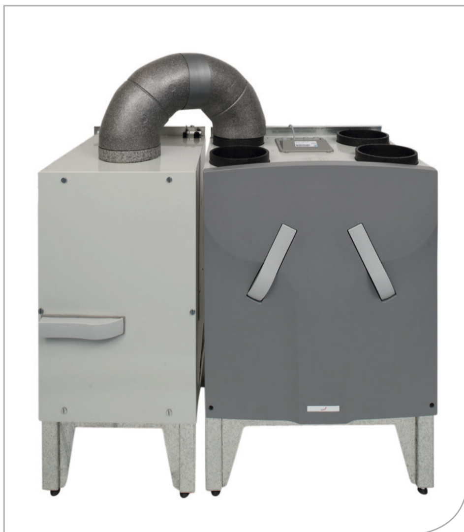
Zehnder ComfoFond-L 550

Produkty te objęte są pełną dwuletnią gwarancją i dostępne będą w promocyjnej cenie do wyczerpania zapasów do końca 2014 r.