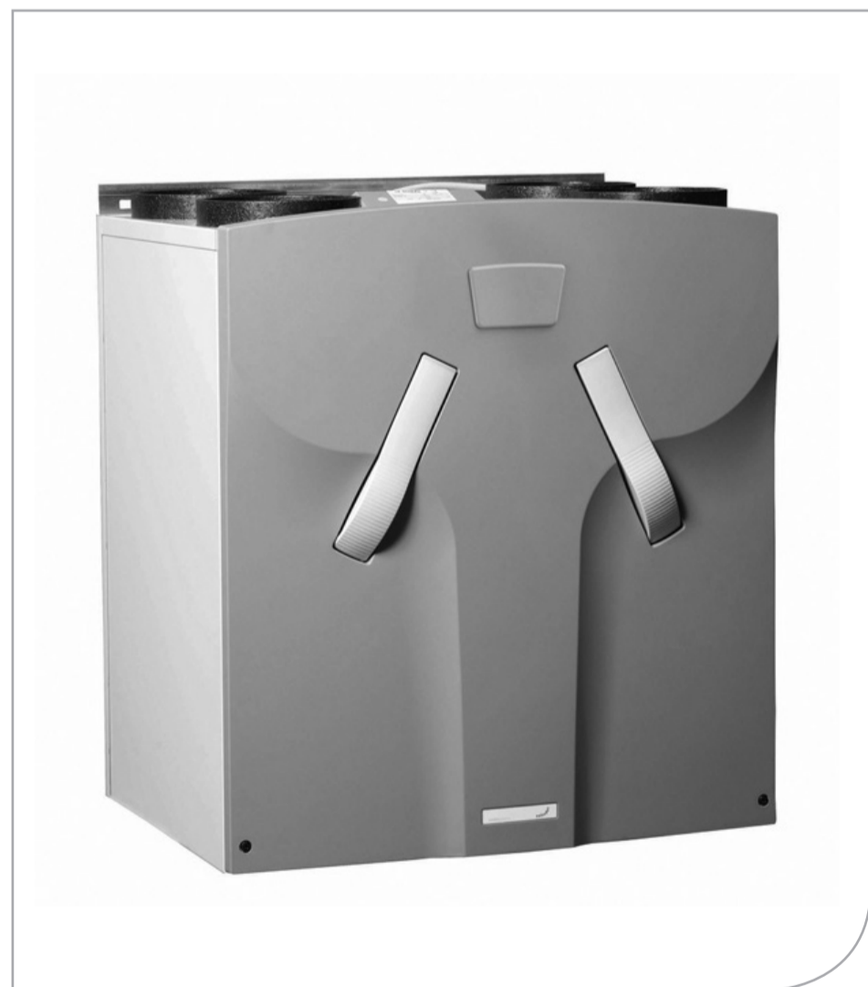
Zehnder ComfoAir 450/550

Przy zakupie jednostki wentylacyjnej w pakiecie z gruntowym wymiennikiem ciepła otrzymają Państwo na Zehnder ComfoFond-L 5% dodatkowego rabatu. Przy jednoczesnym zamówieniu drugiego pakietu, na Zehnder ComfoFond-L otrzymają Państwo 10% dodatkowego rabatu.