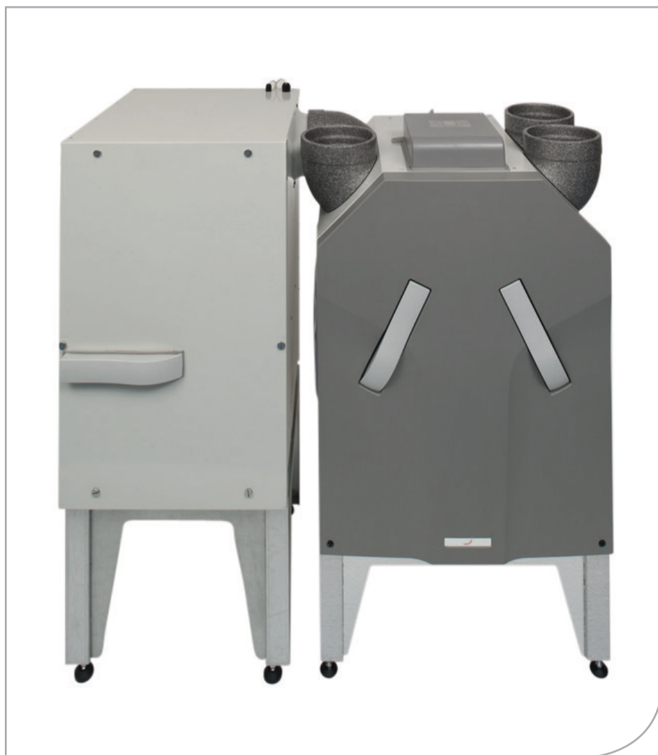
Zehnder ComfoAir 350 + ComfoFond-L 350