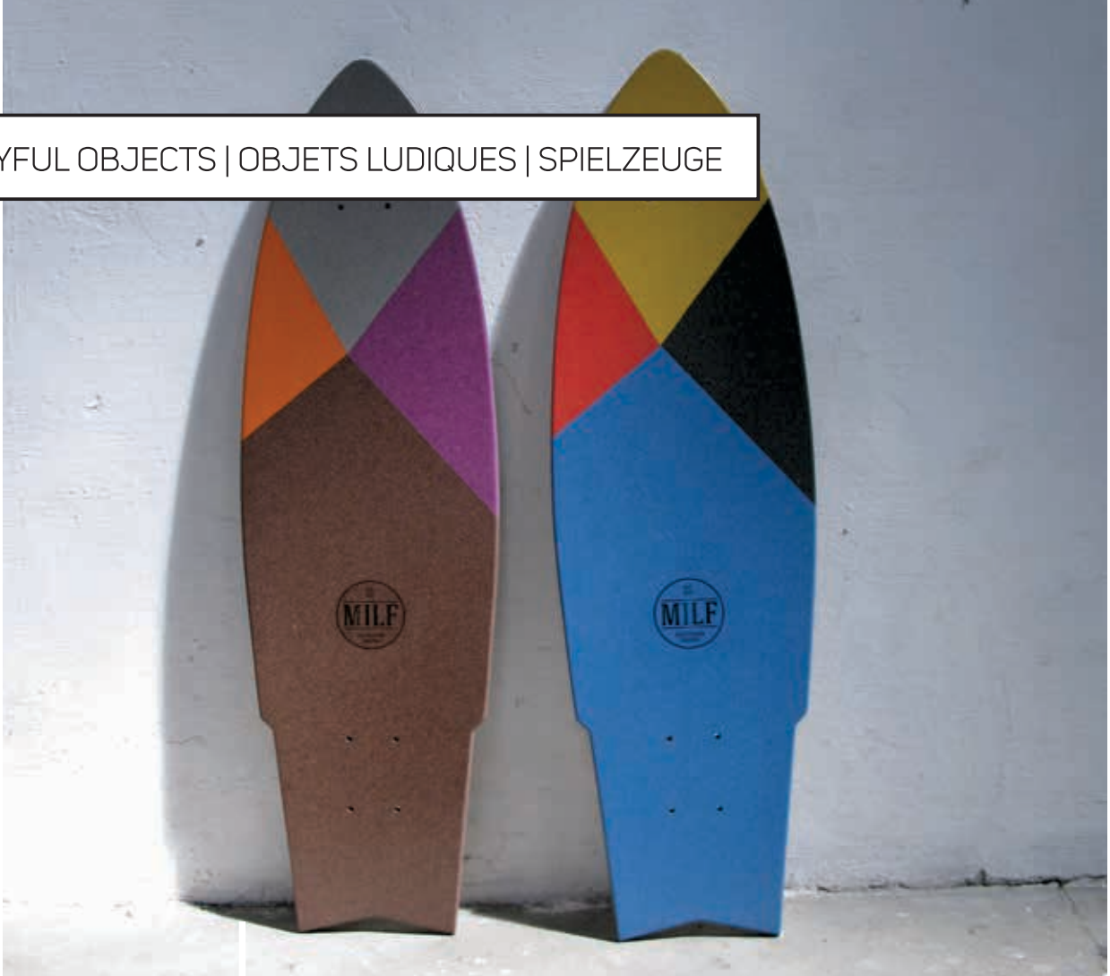
MILF Skateboard Taylors Porto, Portugal