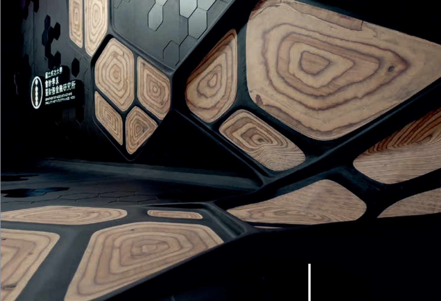
Dep. of Accountancy and Institute of Finance National Cheng Kung University Design: Sky Associative Design Team Taiwan