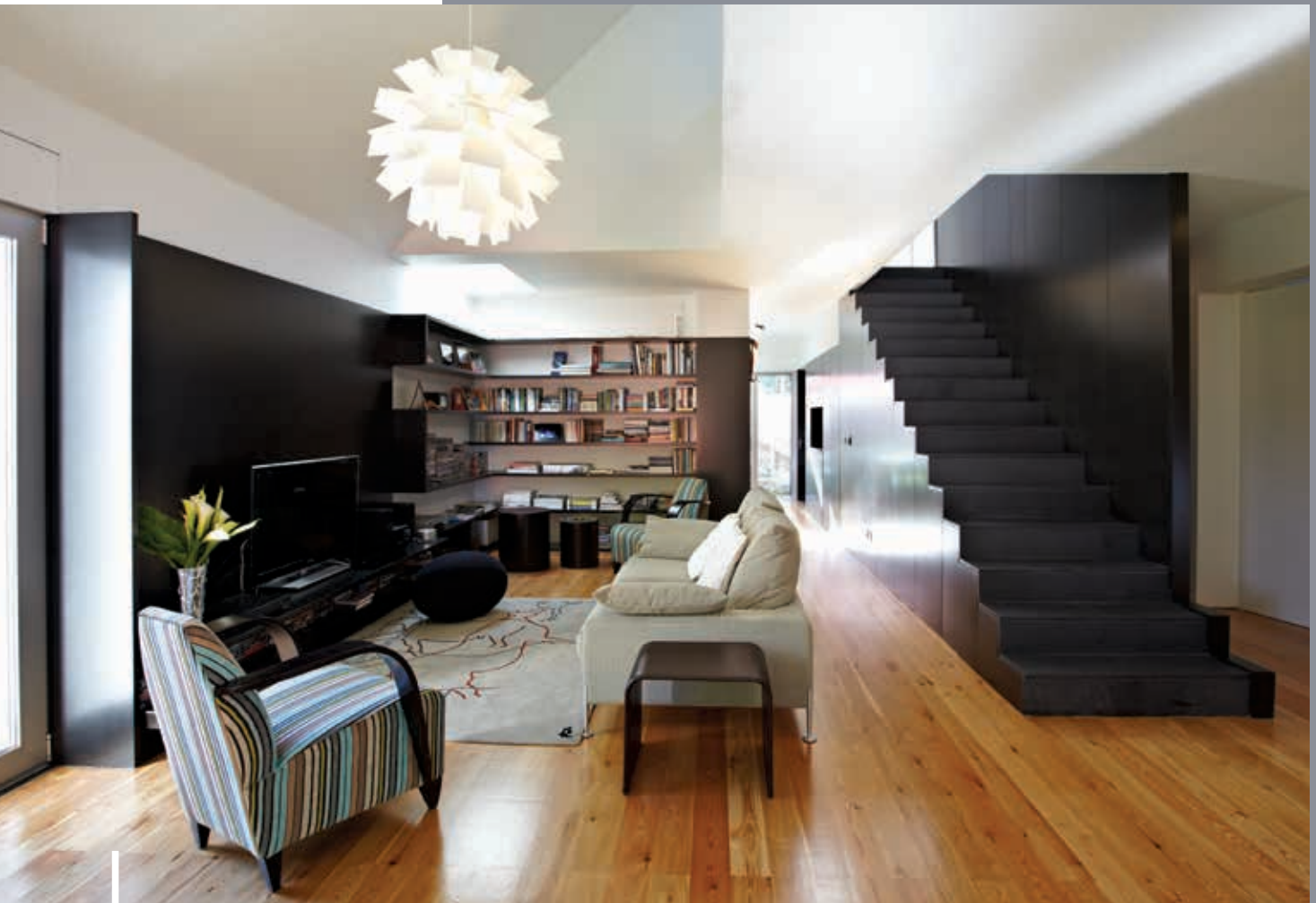
Casa Funchal Architecture: Baixa atelier Funchal, Portugal