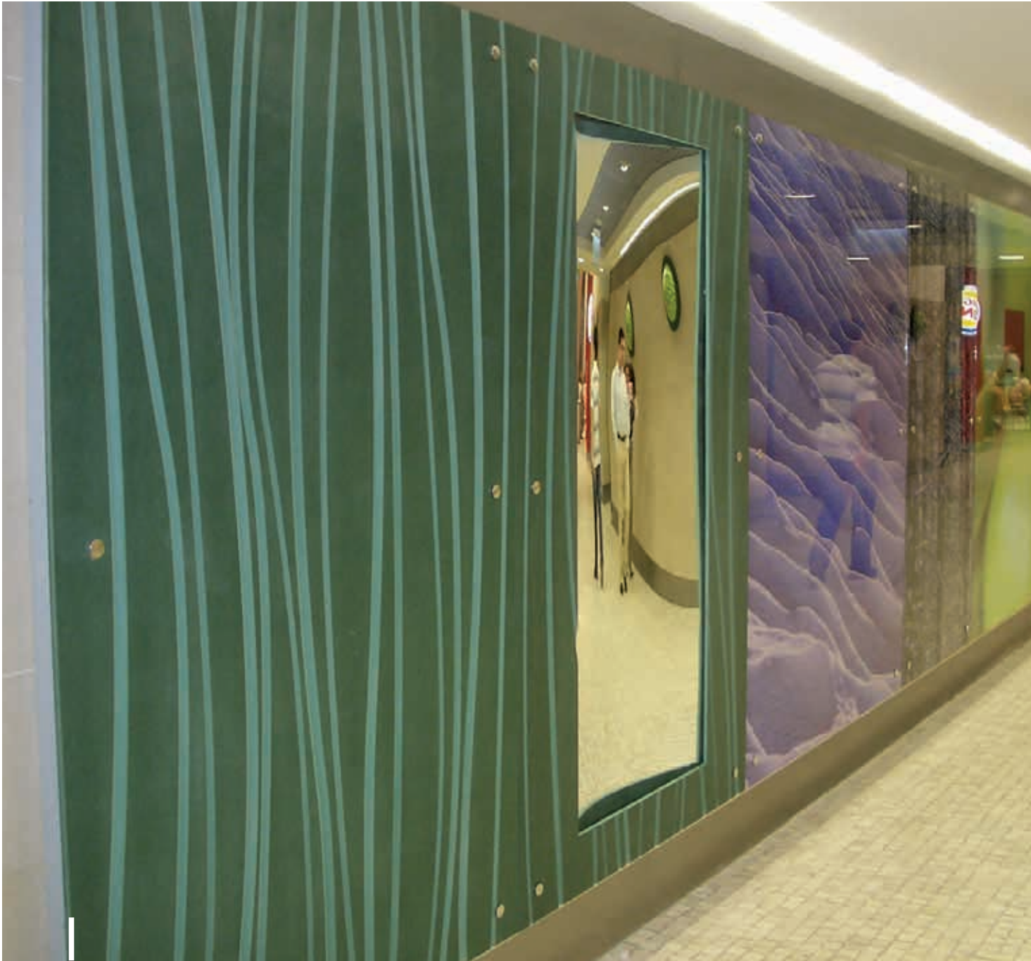
Centro Comercial Campo Pequeno Architecture: José Bruschy Lisbon, Portugal