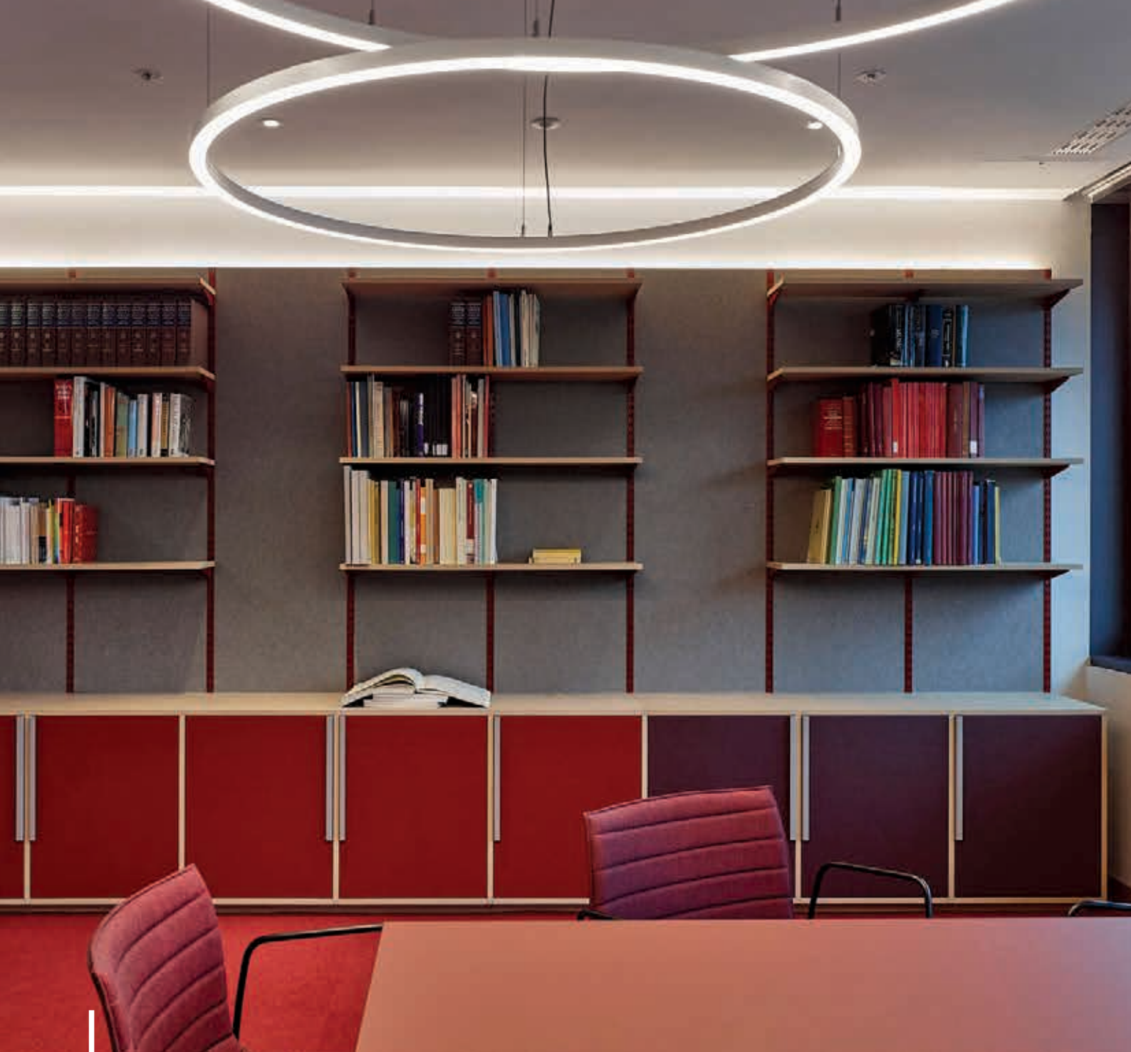
Askonas Holt Architecture: Jackdaw Studio UK