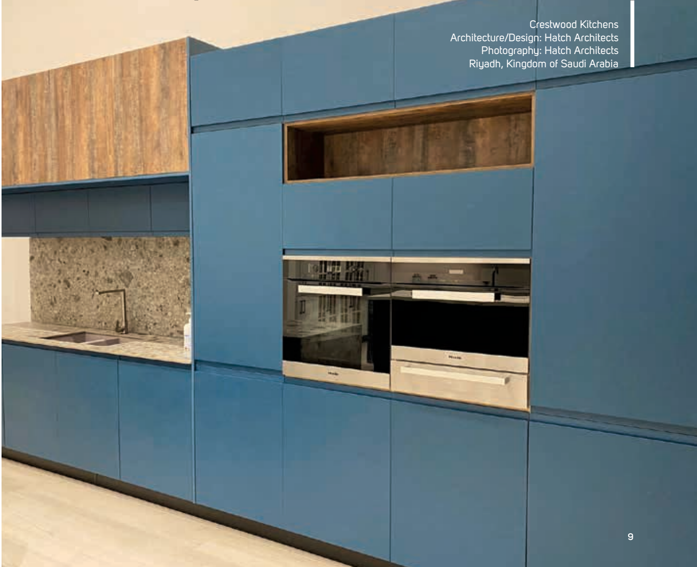
Crestwood Kitchens Architecture/Design: Hatch Architects Riyadh, Kingdom of Saudi Arabia