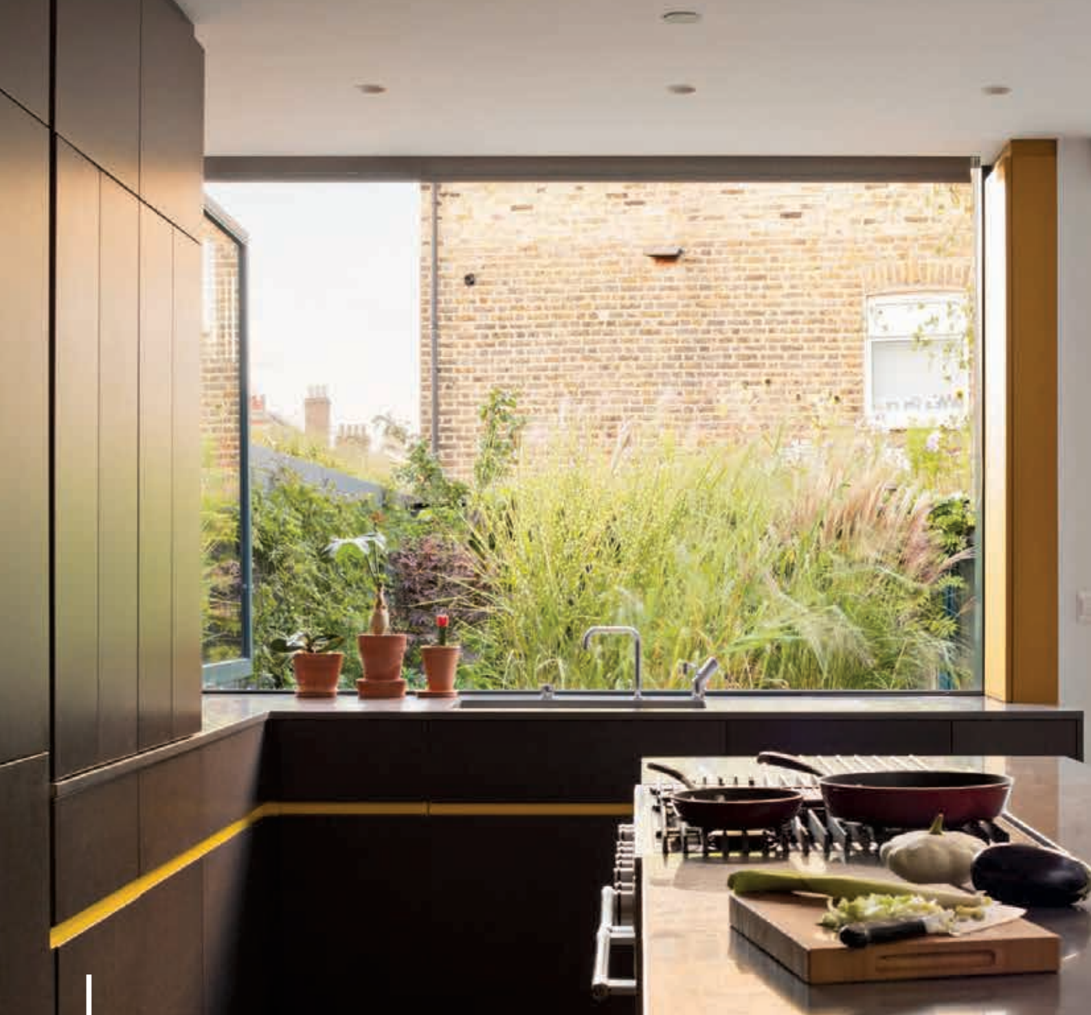
Kitchen Architecture: Findlay Fraher