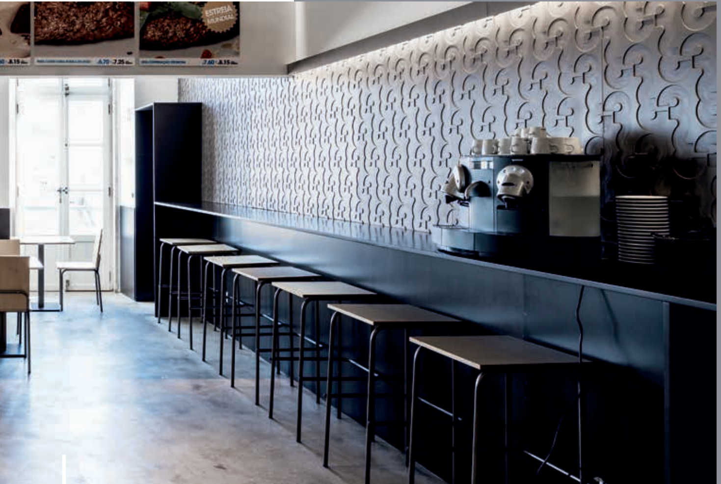
H3 Restaurant Architecture: Ricardo Gonçalves e Tomás Salles