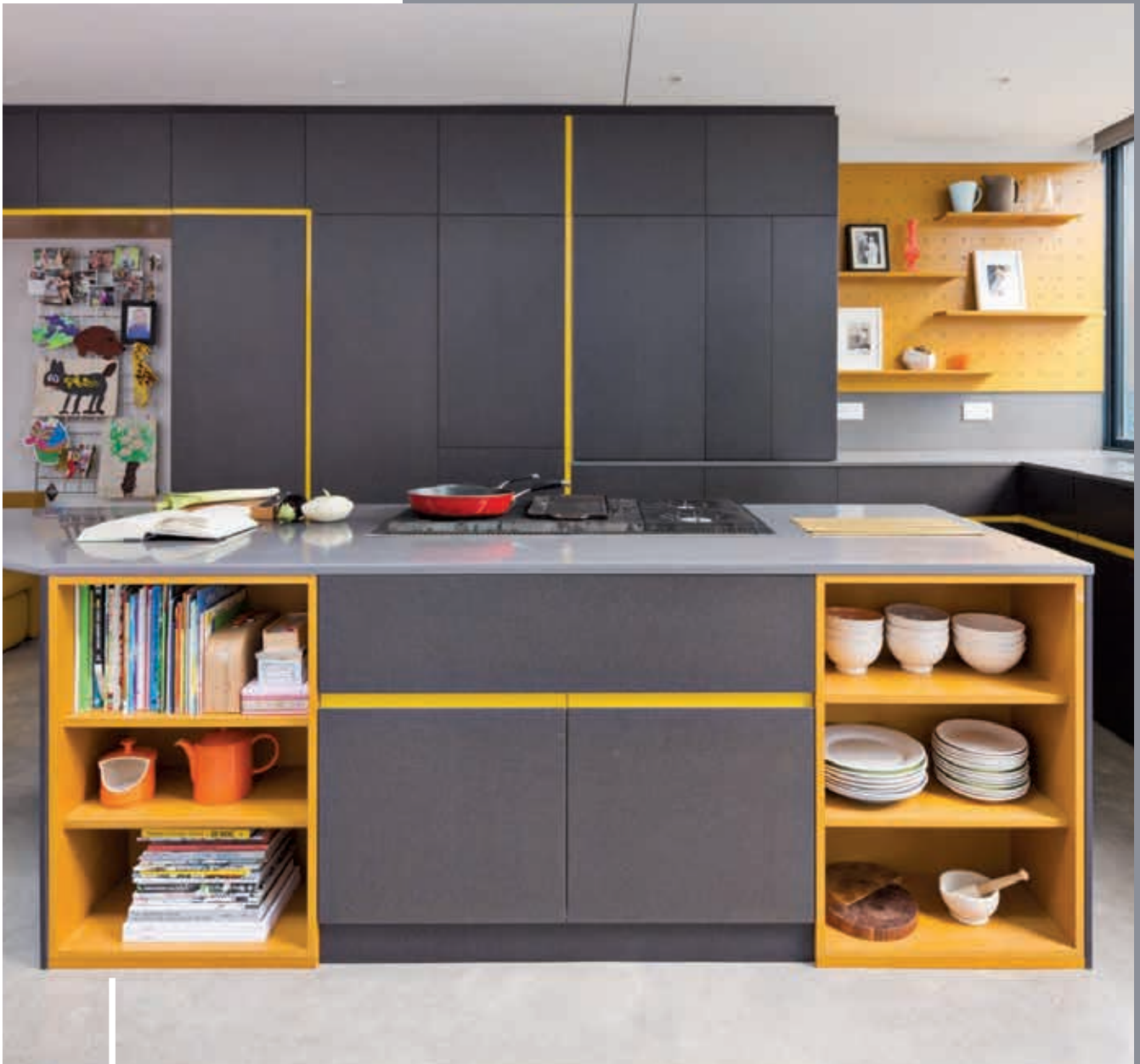
Etching House Architecture: Findlay Fraher