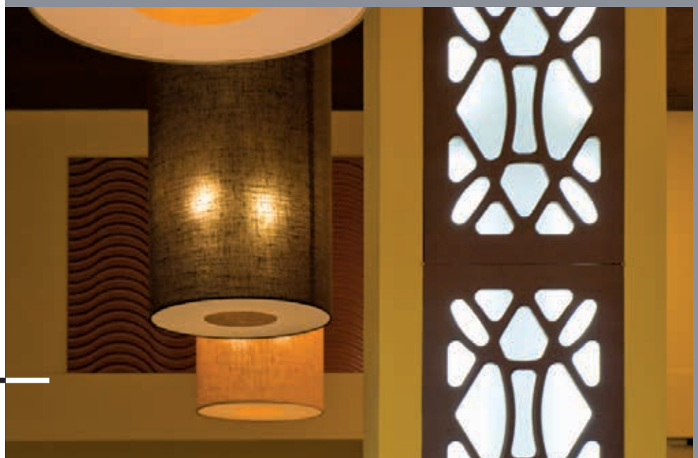
Ishmaelite Church Architecture: Miguel Mira Arquitectura e Planeamento Lda Oeiras, Portugal