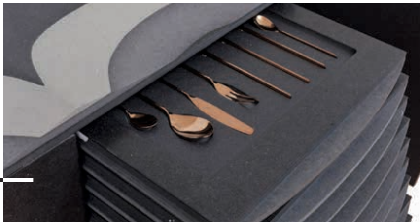
Design: Gabriela Pinto (Cavalo Branco)