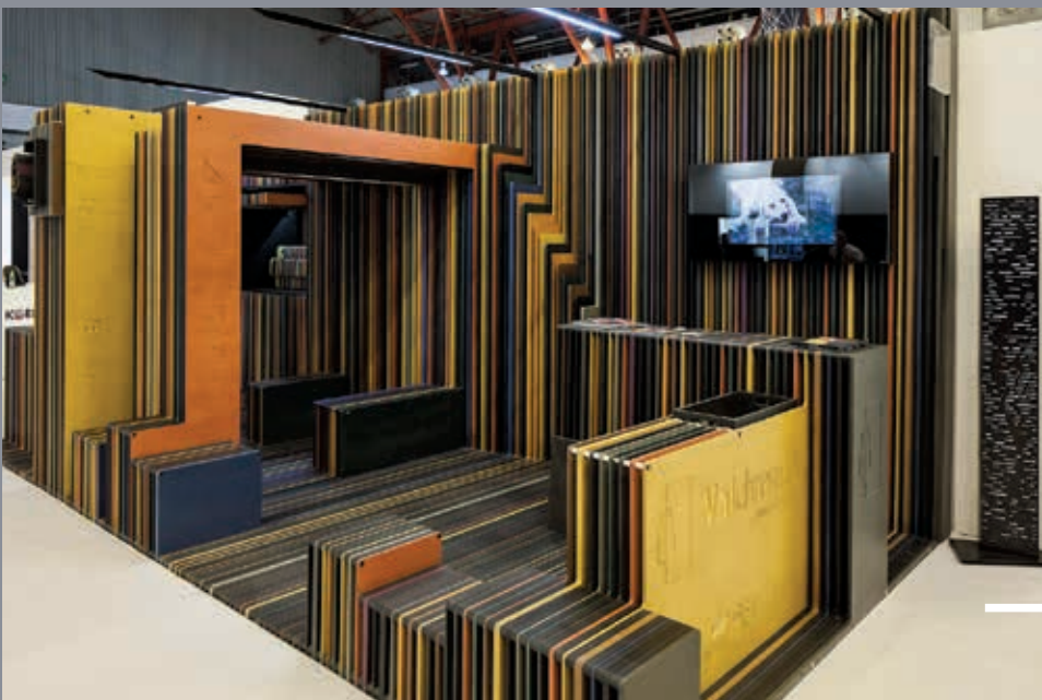
Valchromat Stand 100% Design London, UK