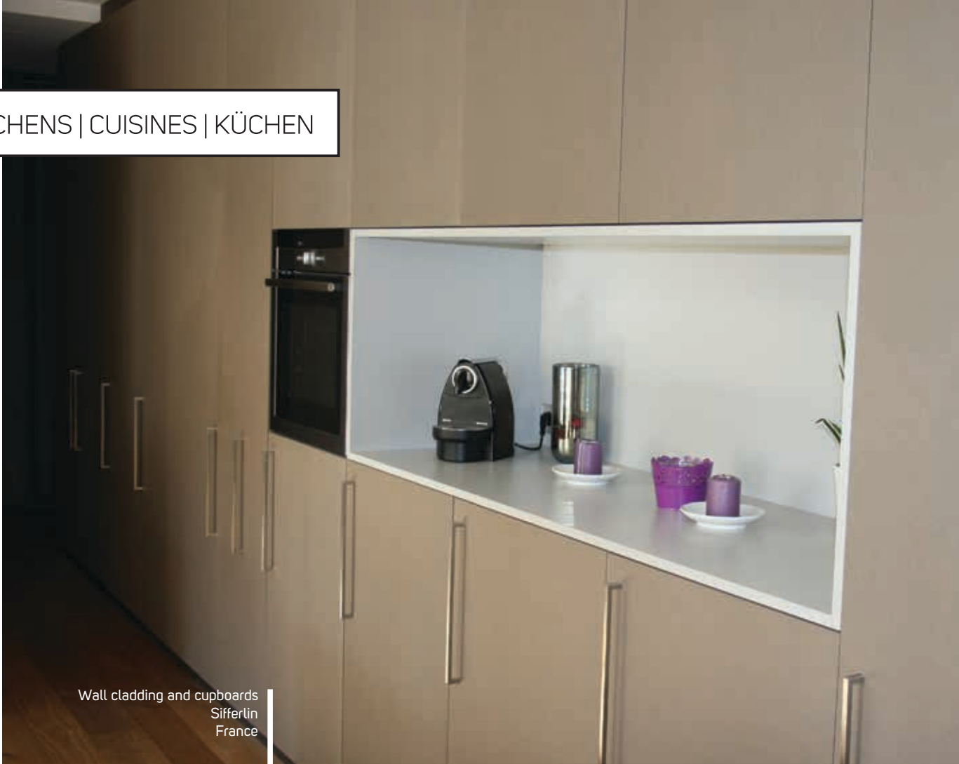
Wall cladding and cupboards Siffertin France