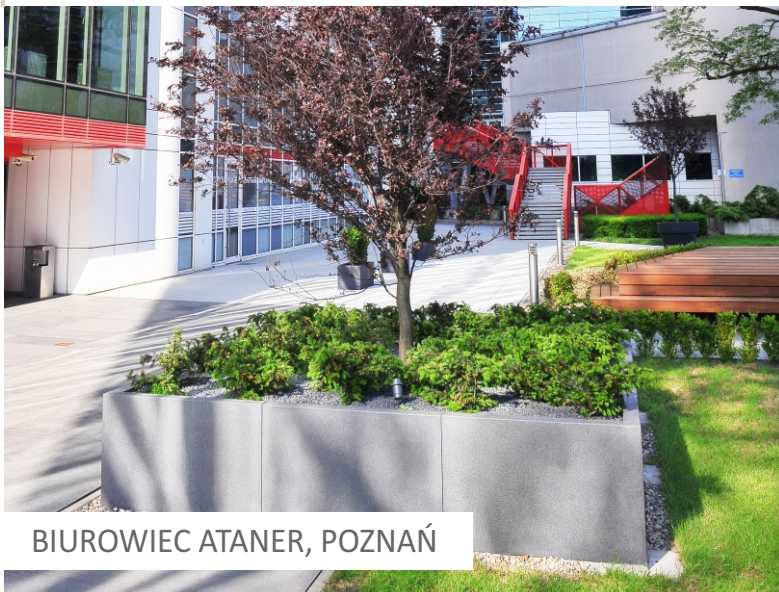
BIUROWIEC ATANER, POZNAŃ

Betonowe donice i pojemniki na odpady to praktyczne oraz stylowe rozwiązanie dla każdego ogrodu lub przestrzeni publicznej. Oferujemy szeroki wybór donic, pojemników, a także podobnych wyrobów o różnych rozmiarach, kształtach oraz kolorach , które idealnie sprawdzą się zarówno w nowoczesnych, jak i tradycyjnych aranżacjach. Realizujemy autorskie projekty małej architektury.