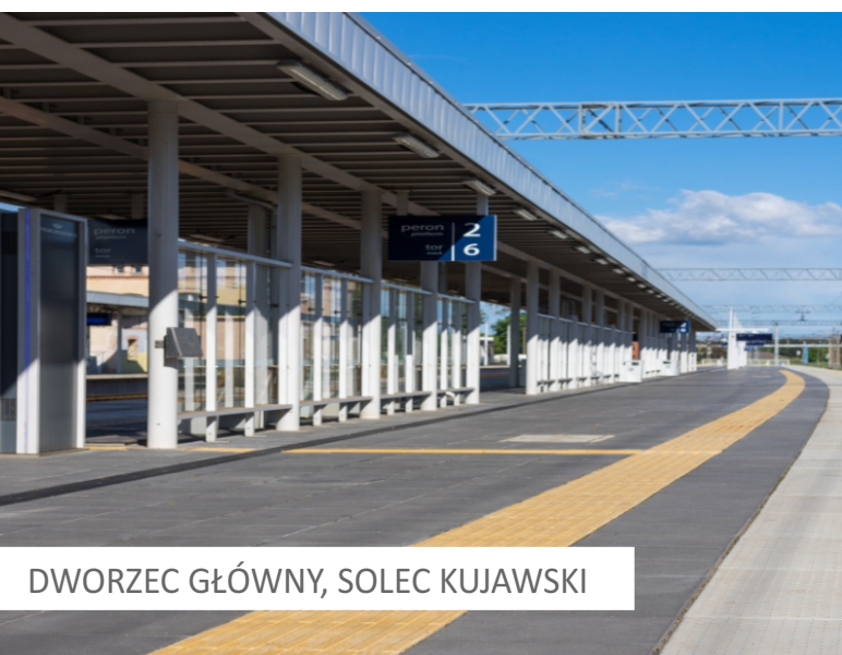
DWORZEC GŁÓWNY, SOLEC KUJAWSKI