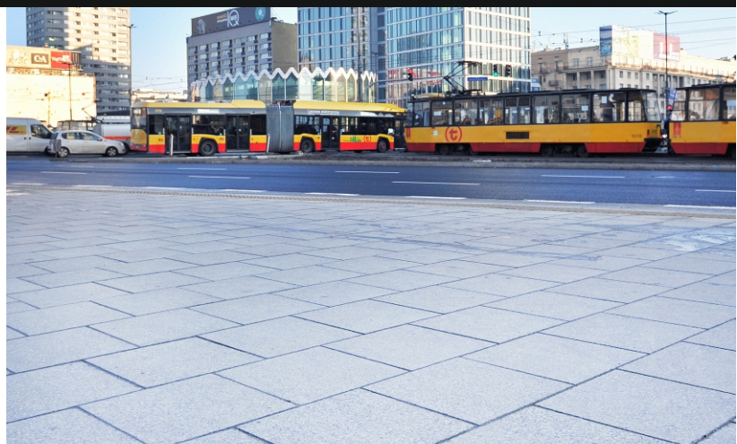
RONDO R. DMOWSKIEGO, WARSZAWA

Płyty marki DASAG dostępne są w wielu formatach i kształtach, co umożliwia nieskończone możliwości aranżacyjne. Dzięki temu są one bardzo uniwersalnym materiałem, który może być stosowany w różnego rodzaju projektach, np. w budowie dróg, chodników, parkingów, placów zabaw, a także w aranżacji przestrzeni publicznej, jak i prywatnej.