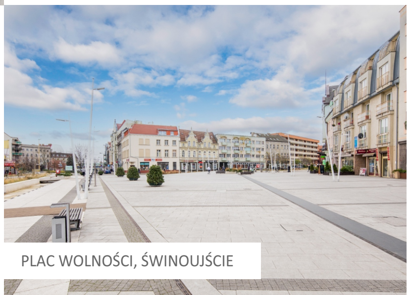
PLAC WOLNOŚCI, ŚWINOUJŚCIE

Płyty wielkoformatowe to materiał o bardzo dużych możliwościach projektowych. Dzięki nim można stworzyć oryginalne i niepowtarzalne aranżacje, a jednocześnie zapewnić sobie wysoką jakość techniczną i trwałość. Płyty te są dostępne w różnych formatach, grubościach oraz wzorach. Realizujemy zamówienia indywidualne w których wzór, format oraz rodzaj wykończenia są dostosowywane do wymagań projektu.