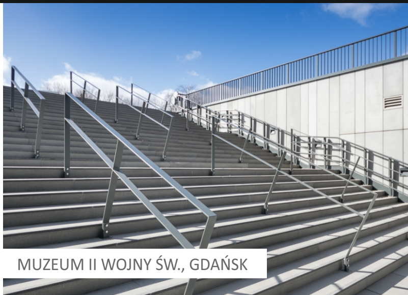
MUZEUM II WOJNY ŚW., GDAŃSK

Zarówno elementy kątowe , jak i okładziny składające się z nastopnicy i podstopnicy , umożliwiają łatwe wykonanie nowych schodów oraz renowację zużytych biegów schodowych. Dzięki dostępnej opcji zastosowania wkładek kontrastowych oferujemy możliwość zaprojektowania schodów, które nie tylko będą estetyczne, ale również bezpieczne.