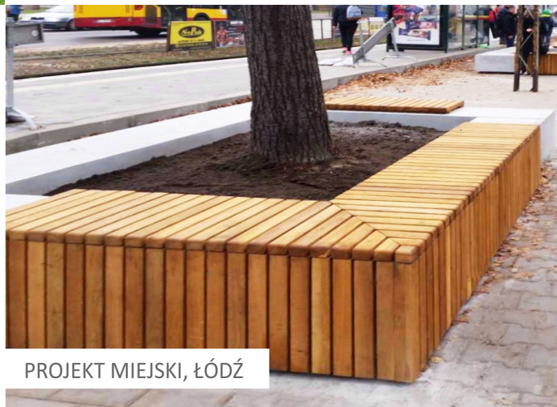
PROJEKT MIEJSKI, ŁÓDŹ

Betonowe meble wykorzystane w ramach małej architektury miejsc publicznych stanowią ciekawe i praktyczne rozwiązanie. Przede wszystkim są bardzo trwałe i odporne na działanie czynników atmosferycznych , a przy tym łatwo wpasować je w krajobraz placów, skwerów czy parków. Ławki z betonu architektonicznego to produkt, który można dodatkowo wzbogacić o elementy drewniane lub metalowe, tworząc estetyczną i funkcjonalną kompozycję.