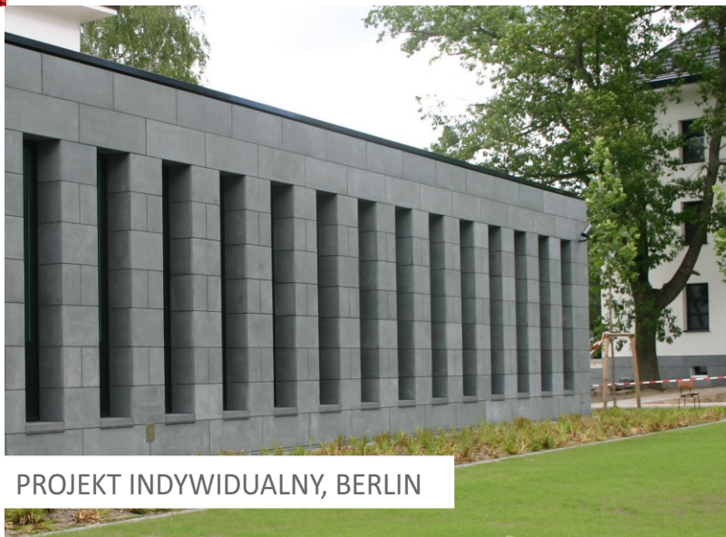
PROJEKT INDYWIDUALNY, BERLIN

Płyty fasadowe z betonu szlachetnego są poddawane procesom, które umożliwiają uzyskanie gładkiej i jednolitej powierzchni o bardzo wysokiej odporności na uszkodzenia mechaniczne, warunki atmosferyczne oraz promieniowanie UV . W połączeniu z innymi produktami marki DASAG, takimi jak płyty nawierzchniowe, schody czy elementy małej architektury, płyty fasadowe pozwalają na stworzenie spójnego projektu.