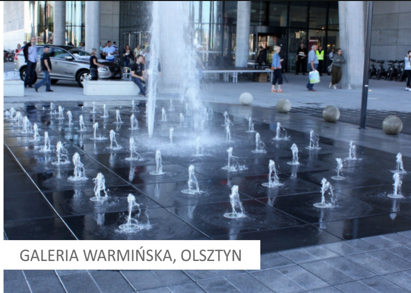
GALERIA WARMIŃSKA, OLSZTYN

Beton szlachetny to doskonały materiał, który znajduje zastosowanie w projektach małej architektury. Jego trwałość, łatwość w kształtowaniu oraz nieograniczone możliwości doboru wzorów to cechy, które pozwalają projektantom na realizację zarówno nowoczesnych, minimalistycznych projektów, jak i tych, które mają za zadanie odtworzenie historycznego charakteru realizacji.